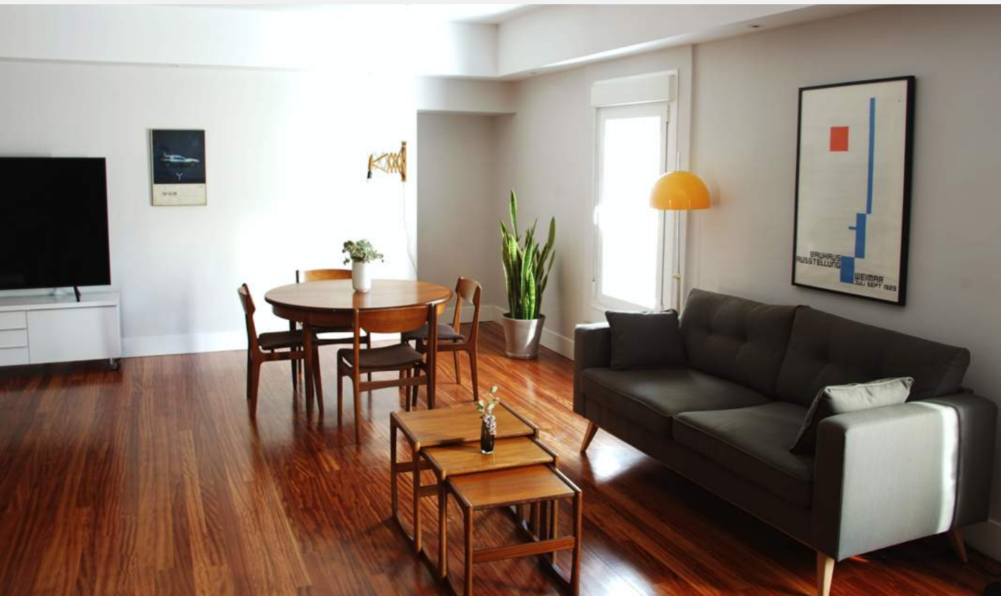
La sala Bauhaus

El espacio del Instituto está disponible para los alumnos que viajen desde fuera, quienes quieran trabajar en sus proyectos o deseen, en algún momento, tomar un café y hacer uso de la biblioteca.