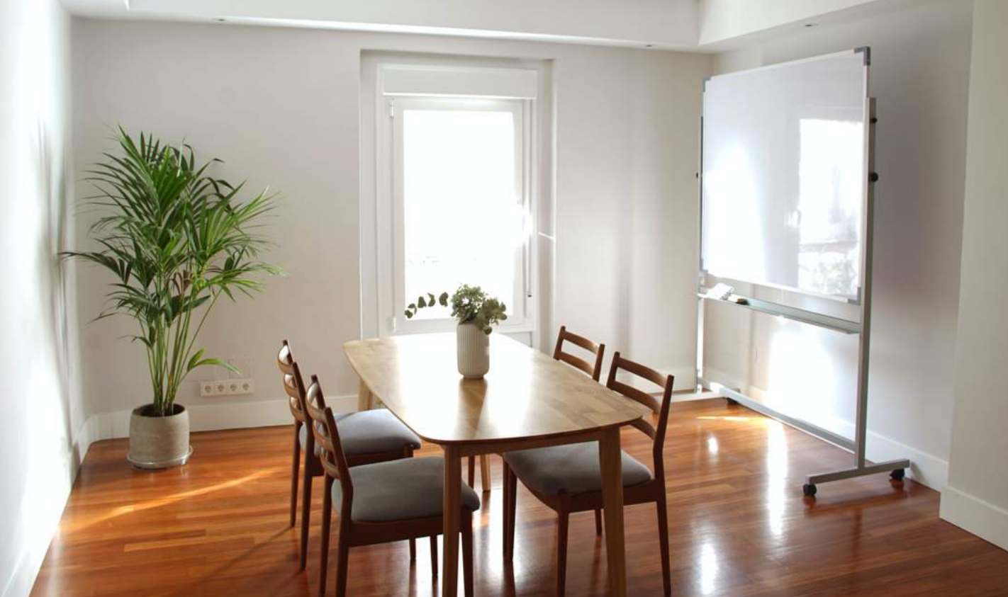
Una de las salas de trabajo